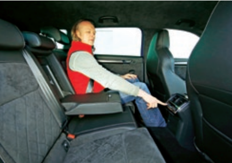
▲ Großzügige Lümmelzone dagegen im Superb. Selbst bei großen Fahrern bleibt Mitfahrern hinten viel Platz

Verbrauchs-Rechnerei Rechnet man nur den Verbrauch auf die ersten 100 km, kommt man bei Peugeot auf 4,8 l und 10,8 kWh und beim Skoda auf 4,9 l und 12,2 kWh