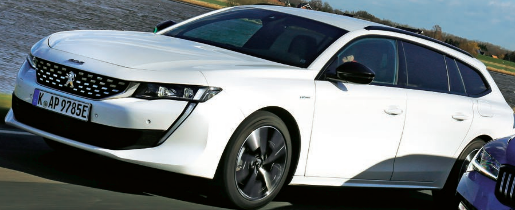
PEUGEOT 508 SW HYBRID 225 225 PS AB 45 100 EURO