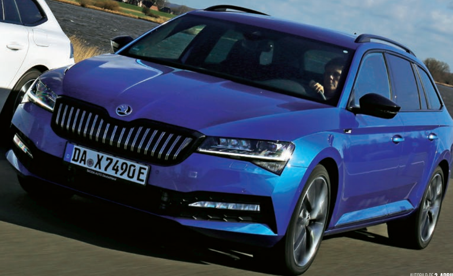
SKODA SUPERB COMBI IV 218 PS AB 42 590 EURO