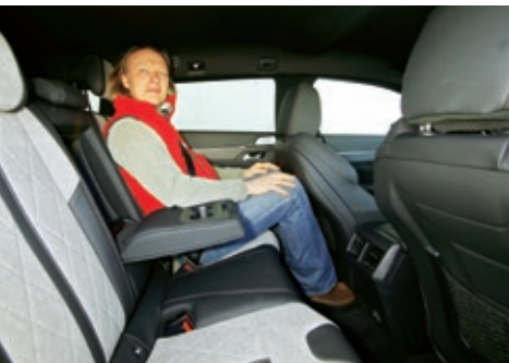
▲ Kurze und flache Sitze, knapper Knie- und Fußraum und ein beengter Einstieg enttäuschen im Peugeot

Genießer werden hingegen den Peugeot-Antrieb zu schätzen wissen. Leise summt er dahin, das Zuschalten des Verbrenners geschieht fast unmerklich. Gerade im Stadtbetrieb kann er seine zwei zusätzlichen Fahrstufen, die sich zudem sanft und nervenschonend via Wandler abwechseln, voll gegenüber dem deutlich ruppigeren Sechsgang-DSG des Skoda auspielen. Der fährt zwar gefühlt öfter im reinen E-Modus, die Messwerte sprechen aber eine andere Sprache. Bündelt er jedoch seine